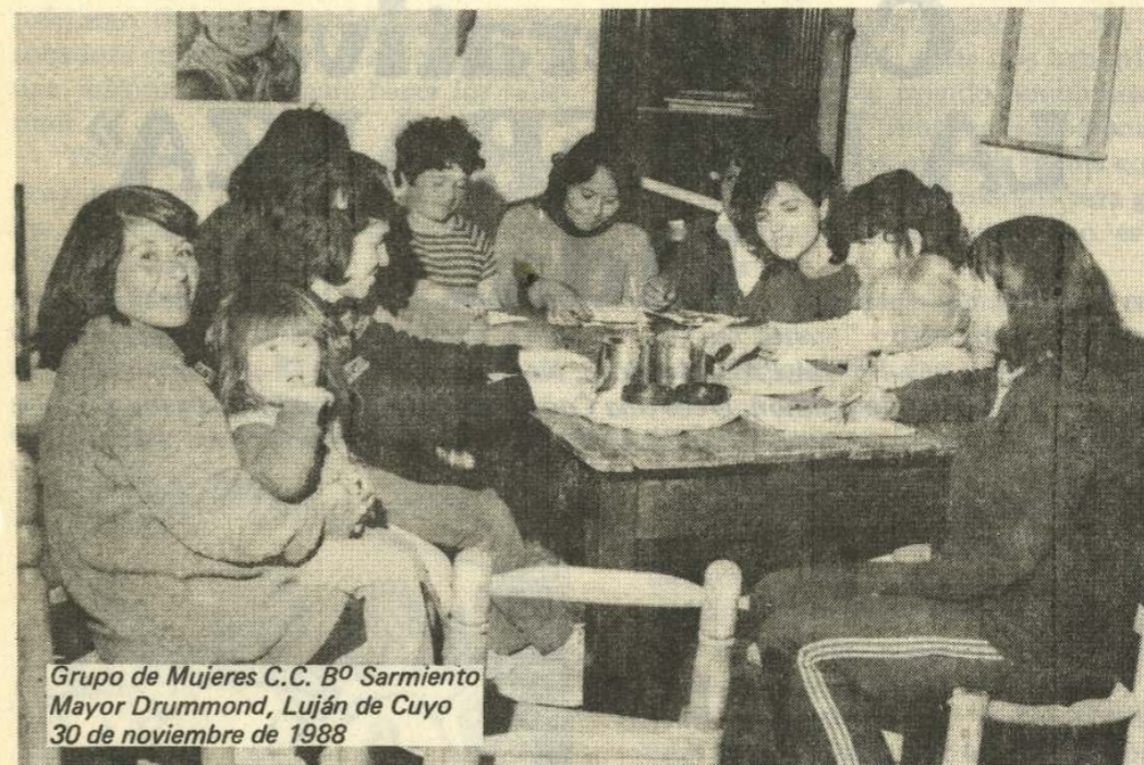
Grupo de Mujeres C.C. B o Sarmiento Mayor Drummond, Luján de Cuyo 30 de noviembre de 1988

Estamos trabajando para tener una Biblioteca Popular y para unirnos cada día más; ¡GRACIAS por hacernos llegar la revista!